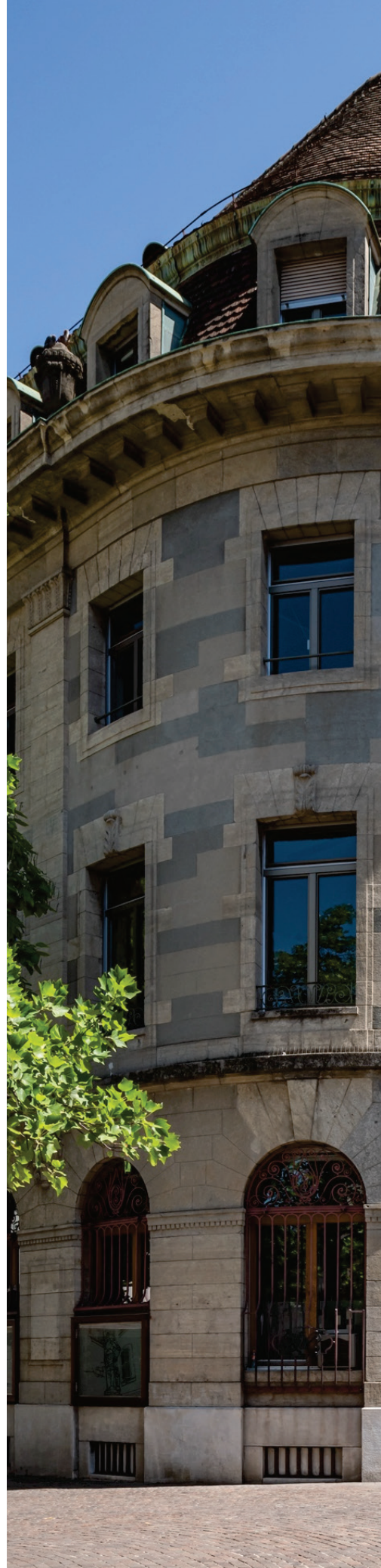
Place Bel-Air 8, Nyon