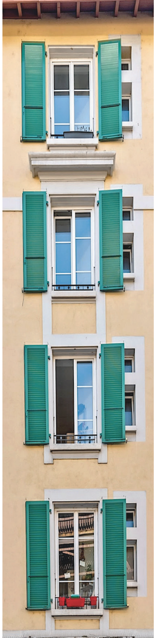
Rue Aimé Steinlen 3-5-7 / Byronne 8 / Coindet 8, VEVEY

*baisse de valeur en 2024 suite à la vente de plusieurs lots PPE