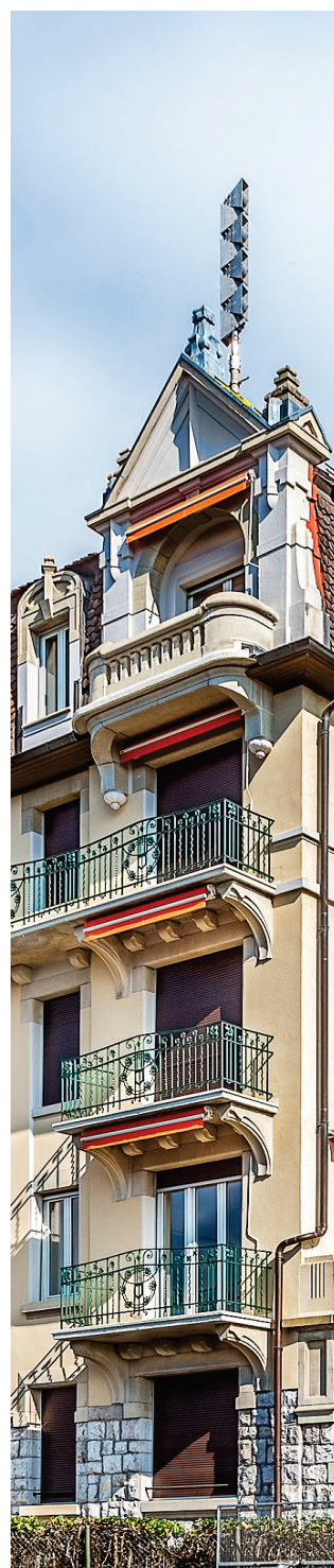
Rue du Centre 1, MONTREUX